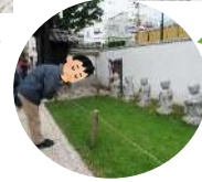
ちやうりゆうじ 長龍寺