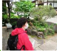
しやうおうじ 松應寺