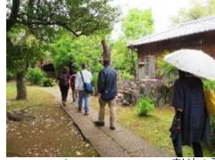
さいしやうじ 西照寺