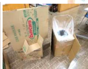
★皆で協力して作った パーティション、防災トイレ