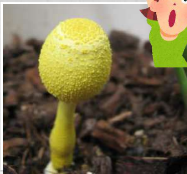
はちう きいろ 鉢植えから黄色いキノコ!?

ねったいちほう 熱帯地方から もちこ 持ち込まれた つち 土を使っている はちう 鉢植えに は 生え て来ることがあるそうです。 であ 出会えたらラッキーな こううん 幸運の キノコみたいですよ。