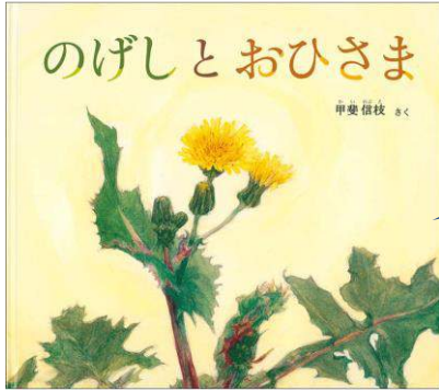
のげしとおひさま

『 えほん 絵本と した 親しもう』というテーマで、2冊の えほん 絵本を よ 読んでいただきました。